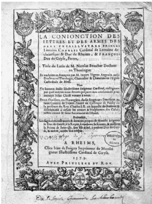
Nicolas Boucher, La Conjonction des lettres et des armes... , Reims, Jean de Foigny, 1579. BM Reims, CR IV 592/2.