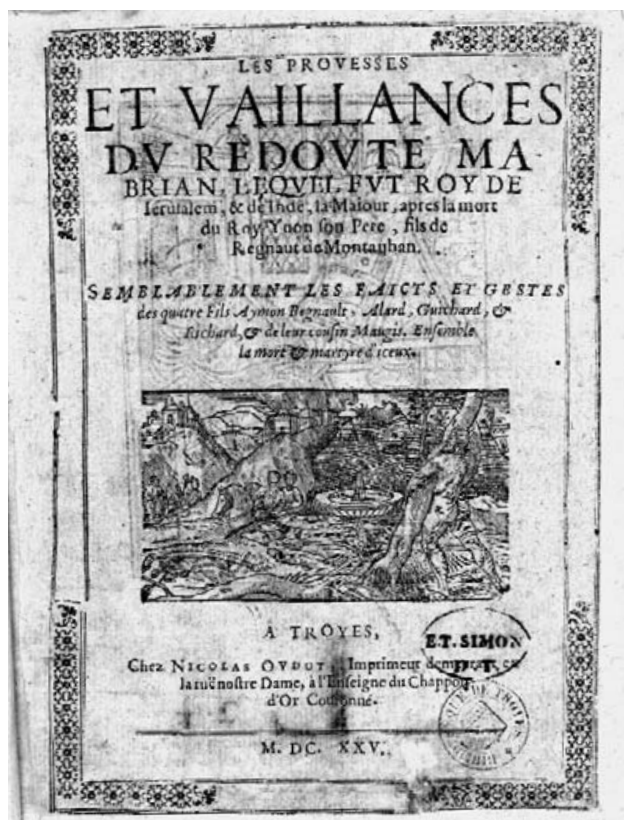
Les prouesses et vaillances du redouté Mabrian... Troyes, Nicolas I Oudot, 1625. MAT, Bbl. 679.