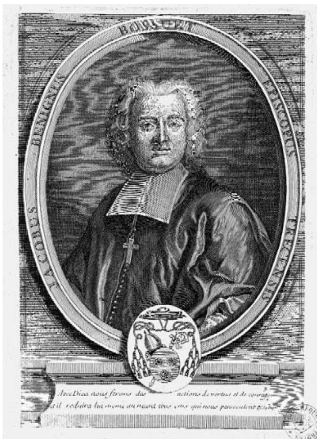
Portrait de Jacques-Bénigne Bossuet, évêque de Troyes de 1718 à 1742. MAT, gravure 178-01.